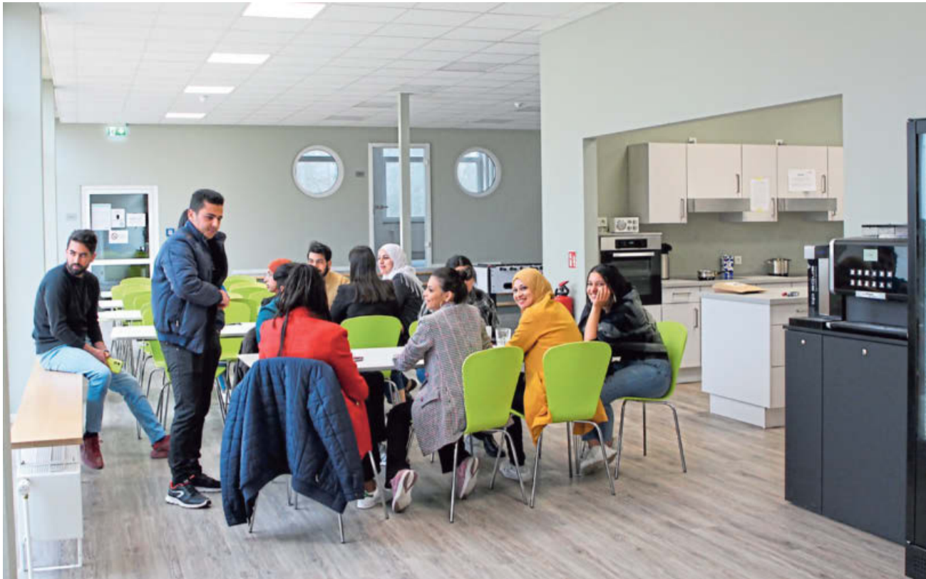
Die Mensa mit großer Gemeinschaftsküche bietet ausreichend Platz, um die unterrichtsfreie Zeit gemeinschaftlich zu verbringen. Auch Billardtisch und Kicker können genutzt werden.