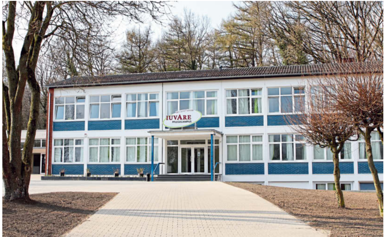
Der Iuvare Pflegecampus ist ein klassisches Internat, in welchem Pflegefachkräfte aus aller Welt zusammenkommen, um gemeinsam unter einem Dach zu leben und zu lernen.