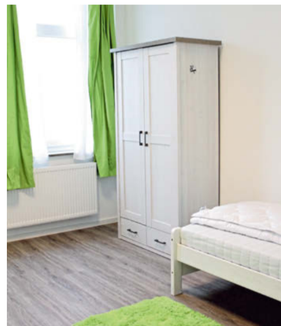
Viele der möblierten Zimmer wurden in den vergangenen Wochen bereits bezogen.